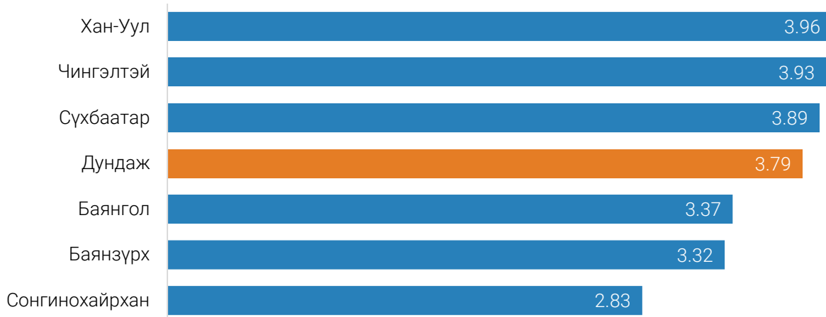
ЗУРАГ 1. ШИНЭ ОРОН СУУЦНЫ ДУНДАЖ ҮНЭ, 2023 оны 6 дугаар сард, Улаанбаатар хотын төвийн 6 дүүргээр, сая төгрөгөөр, м 2

2023 оны 6 дугаар сард хуучин орон сууцны 1 метр квадрат талбайн дундаж үнэ 3.41 сая төгрөг болж, Чингэлтэй дүүрэгт хамгийн өндөр буюу 3.94 сая төгрөг байна.